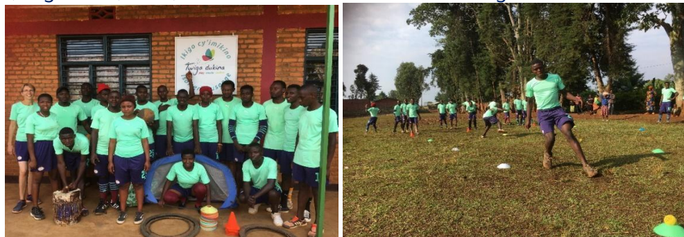
De Twiga dukina coaches tijdens een trainingsweekend.

Deze activiteit creëert verschillende kansen voor kinderen om zich op veel verschillende manieren te ontwikkelen: talentontwikkeling, hersenontwikkeling, fysieke, cognitieve, taal-, morele en emotionele ontwikkeling.