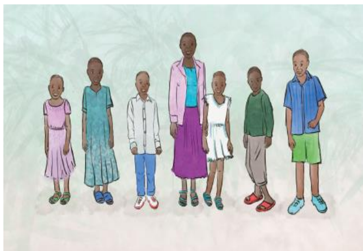
De kinderen met wie het allemaal begon...

In 2022 zijn deze activiteiten weer opgepakt en inmiddels komen de kinderen niet meer bij elkaar in Gerjannes woonkamer, maar in een echt Play Center & Community Library. Een Centrum van waaruit allerlei activiteiten worden georganiseerd.